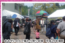
おおぜいの人で賑わう祭り会場 平成26年撮影