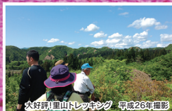
大好評!里山トレッキング 平成26年撮影