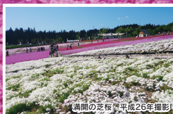
満開の芝桜 平成26年撮影