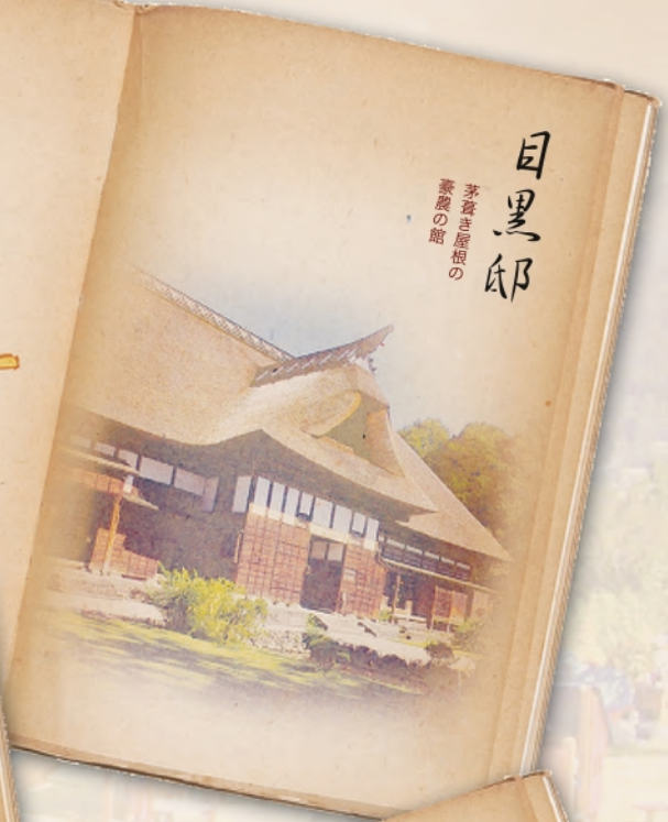
目黒邸 茅葺き屋根の 養蚕の館