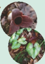
コシノカンアオイ