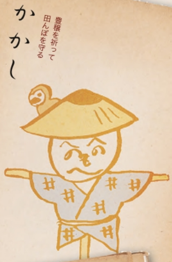
かかし 農稼を折って 田んぼを守る