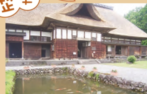
国指定重要文化財 目黒邸

国指定重要文化財であり、新潟県を代表する茅葺屋根の家農の館。寛政9年(1797年)に建築され、割元庄屋の役宅を兼ねていた。併設の資料館には、江戸時代初期からの古文書や生活用具など、歴史的に貴重な資料が展示されている。