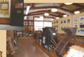
守門村 民俗文化財館