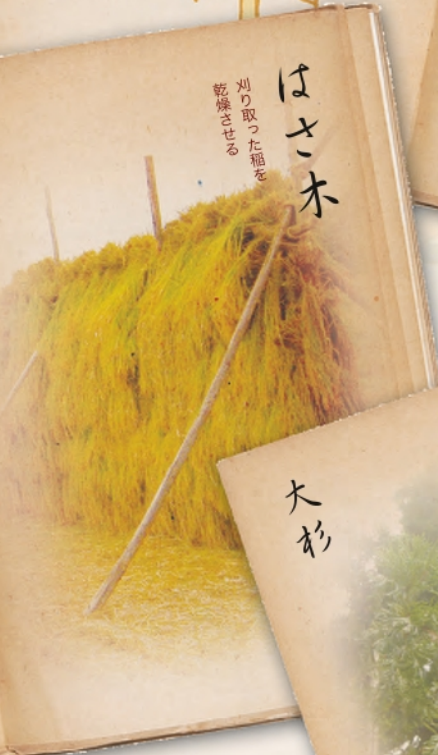
はこ木 刈り取った稲を 乾燥させる