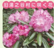
シャクナゲ 開花 4月~6月 花言葉 威厳、荘厳