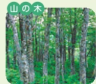
ブナ 開花 5月 花言葉 繁栄