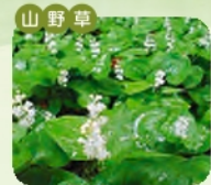
マイヅルソウ 開花 4月~7月 花言葉 清純な乙女の面影