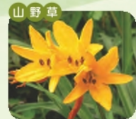
カンゾウ 開花 5月~6月 花言葉 悲しみを忘れる