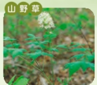
ルイヨウショウマ 開花 5月~8月 花言葉 清純無垢