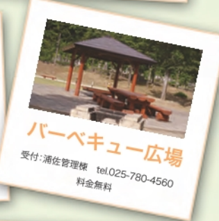
バーベキュー広場 受付：浦佐管理棟 tel.025-780-4560 料金無料