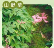
シモツケソウ 開花 5月~8月 花言葉 穏やか