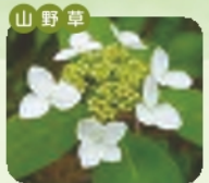
ヤマアジサイ 開花 6月~7月 花言葉 移り気