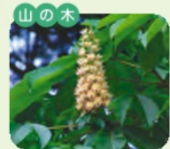
トチ 開花 5月~6月 花言葉 豪奢